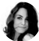
Francesca Petretto Attrice